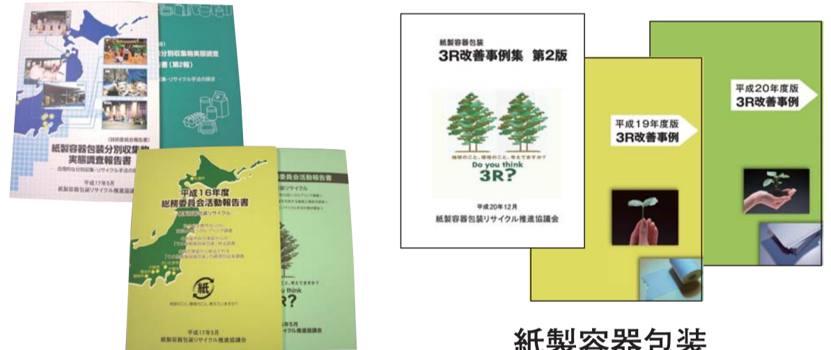
パンフレット・冊子の制作