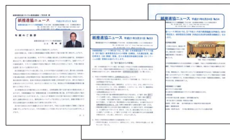
紙推進協ニュースの発行、見学会、セミナー、研修など