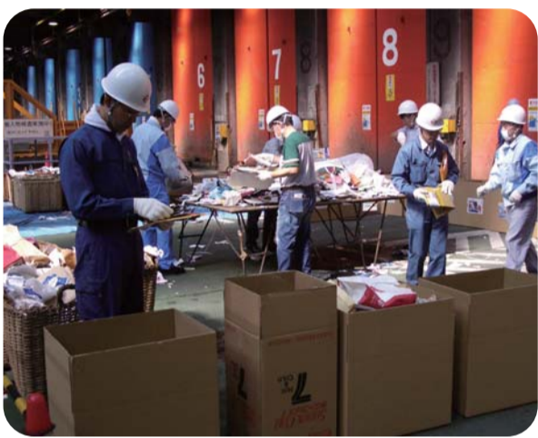
収集物の組成分析 20以上の分類で分別調査