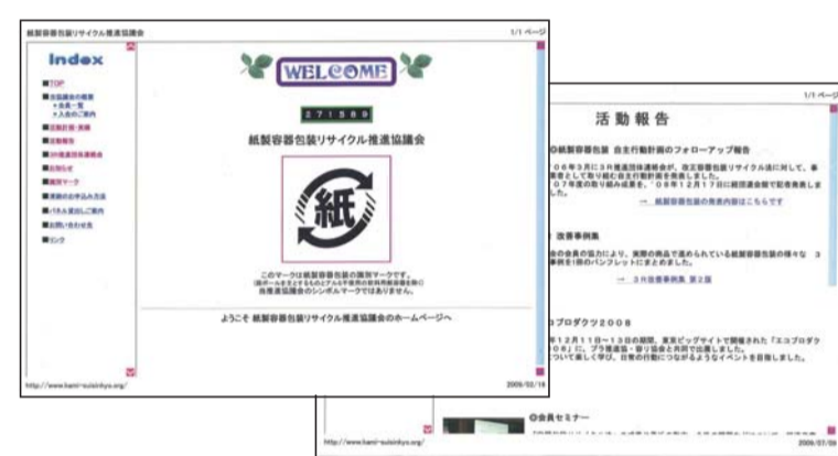
ホームページにて 情報提供