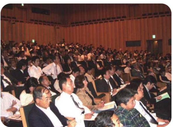
3R推進フォーラム(3R推進団体連絡会)